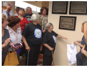
Las expresas desvelando la tarja en reconocimiento al Presidio Político de Mujeres.